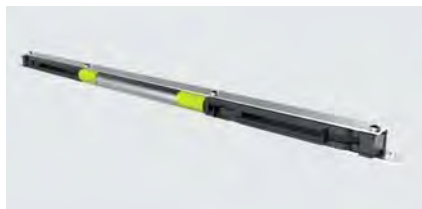
Dämpfer Sidestop X