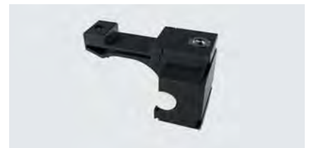
Haltestopper SX 100H, 2 Stück