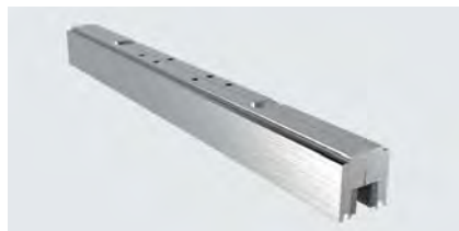
Glasklemme GLM 274087M, 2 Stück