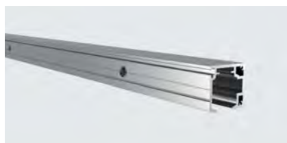
Laufschiene T365, 2250 mm