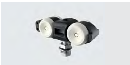
Laufwagen RX100A, 2 Stück

Der Beschlag für moderne Raumgestaltung mit Ganzglasschiebetüren bis zu einem Gewicht von 100 kg. Die neueste Ausführung der GLM Glasklemmen überzeugt durch die eloxierte Oberfläche und die verbesserte Montagefreundlichkeit. Die schlanke Aluminiumverblendung verbirgt die Aufhängetechnik elegant und verleiht dem Beschlag eine einheitliche Optik.