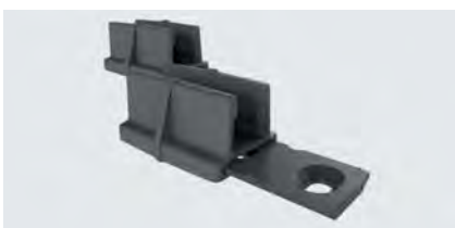
Bodenführung T-Guide Glas